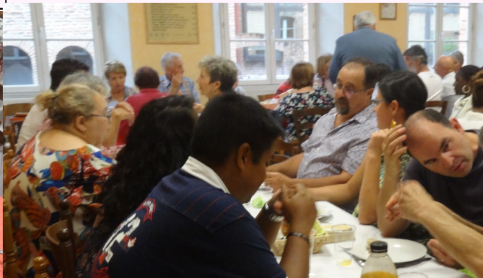
Souvenirs : repas après le culte de rentrée (22 Septembre 2019)