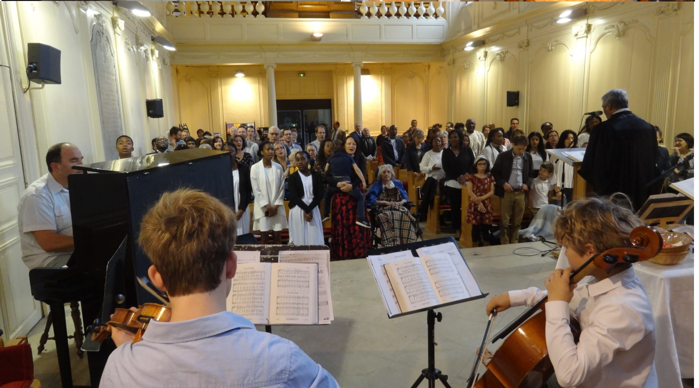
A Pâques, chants dans les couloirs de la Maison de retraite, et une vue de l'assistance au culte